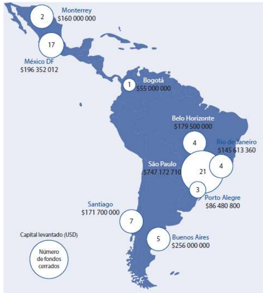
Gráfica 2: Principales centros de capital de riesgo en América Latina, 2011-15 (Capital levantado (USD) y número de fondos cerrados)